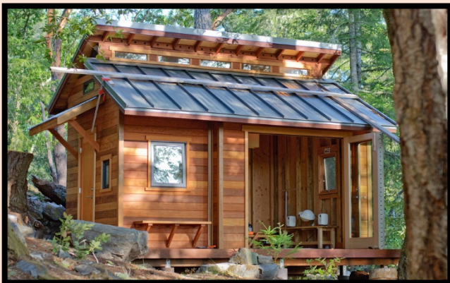
บ้านเดี่ยว (บ้านประกอบเสร็จ)