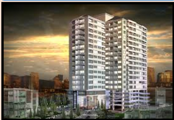
คอนโดมิเนียม