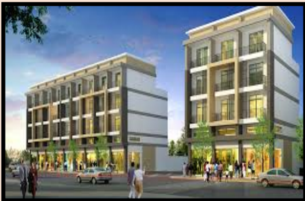
อาคารพาณิชย์กรม