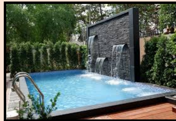
สระว่ายน้ำ