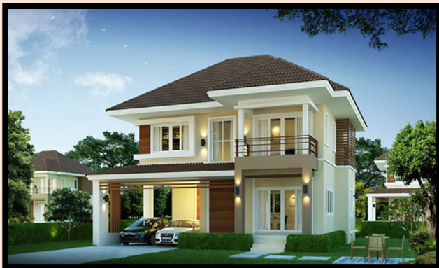
บ้านเดี่ยว