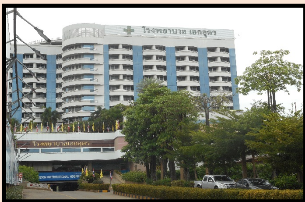
สถานพยาบาล