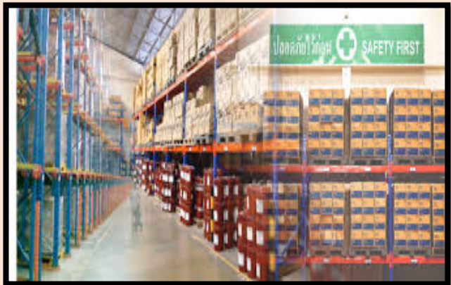
คลังสินค้า