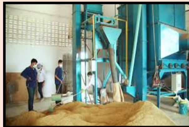
โรงสีข้าว