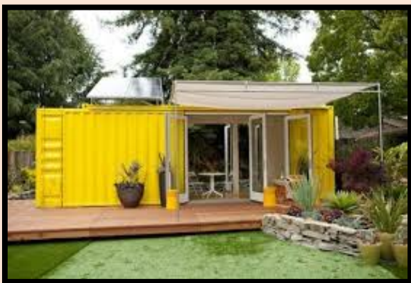
ตู้คอนเทนเนอร์ (ใช้เป็นสำนักงาน/อยู่อาศัย)