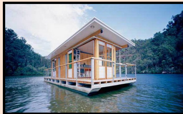
บ้านเดี่ยว (บ้านเรือนแพ)