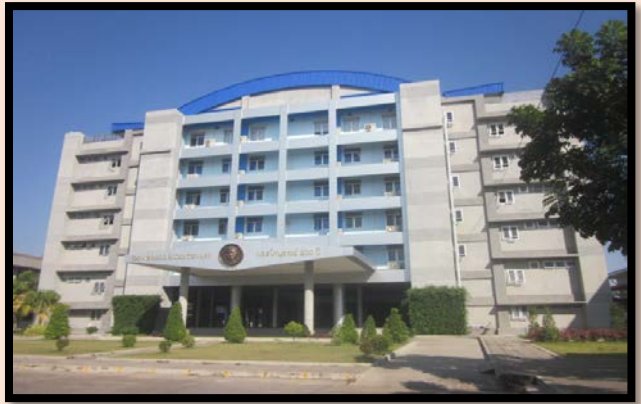
สถานศึกษา