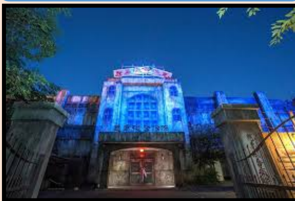
บ้านผีสิงในสวนสนุก