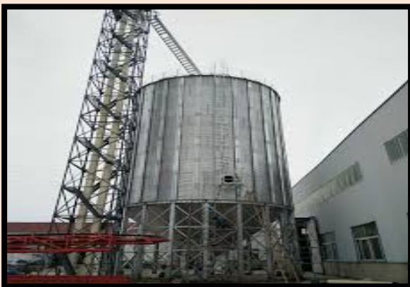
ไซโลเก็บอาหาร