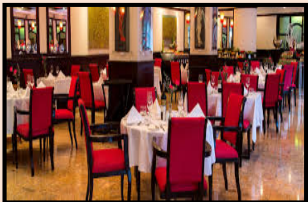
ภัตตาคาร